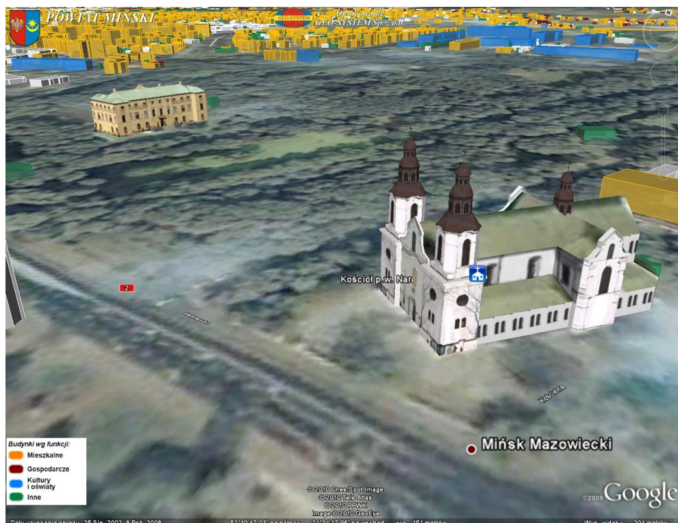
ryc. 3 Prezentacja trójwymiarowa przygotowana z wykorzystaniem danych gromadzonych w zasobie geodezyjnym i kartograficznym, po modyfikacji obiektów

Jedną z najbardziej oczekiwanych przez środowisko wykonawców prac geodezyjnych funkcji serwisów internetowych było zgłaszanie prac geodezyjnych. Taką funkcję uruchomiliśmy na początku 2008 roku. Możliwość automatycznej obsługi prac uzyskuje się po zarejestrowaniu w serwisie ePODGiK. Rejestracja polega na podpisaniu stosownej umowy oraz uzyskaniu hasła dostępu wymaganego przy zgłaszaniu prac. Tak zalogowany wykonawca uzyskuje drogą internetową materiały, wygenerowane przez Ośrodek, niezbędne do wykonania zgłoszonej pracy. Elektroniczny system zgłaszania prac geodezyjnych, dostępny jest dla jednostek wykonawstwa geodezyjnego 24 godziny na dobę przez 7 dni w tygodniu. Z usług internetowego zgłaszania prac korzysta już 184 firmy, a od uruchomienia serwisu obsłużono automatycznie ponad 12 tys. zgłoszeń, co stanowi 85 % ogółu. W roku 2010 w okresie trzech kwartałów usługę tę wykorzystano ponad 4 tys. razy.