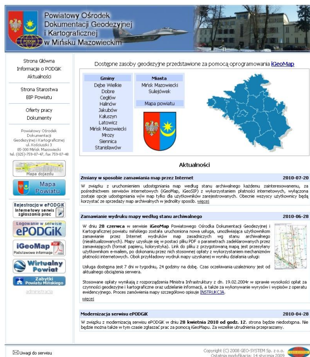
ryc.1 Strona internetowa PODGiK